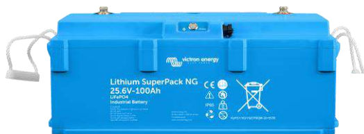
Lithium SuperPack 12,8/200 NG y 25,6/100 NG