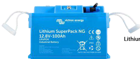
Lithium SuperPack 12,8/100 NG