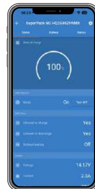
Datos de la batería mostrados en tiempo real en VictronConnect