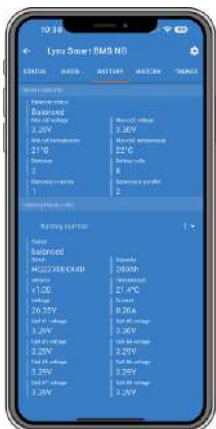
Resumen completo de todos los datos de baterías mediante VictronConnect (o un dispositivo GX y VRM)

Las baterías Lithium NG de Victron Energy son baterías de fosfato de hierro y litio (LiFePO 4 o LFP) disponibles en distintas capacidades con tensiones nominales de 12,8 V, 25,6 V y 51,2 V. Pueden conectarse en serie, paralelo o en una combinación de ambas, de modo que se pueden montar bancadas de baterías para tensiones del sistema de 12 V, 24 V o 48 V. Se puede usar un máximo de 50 baterías para configurar una bancada con baterías de 12 V o 24 V, y de 25 si se trata de baterías de 48 V. De este modo, se puede tener una capacidad máxima de almacenamiento de energía de 192 kWh con baterías de 12 V, y de hasta 384 kWh con baterías de 24 V y 128 kWh con baterías de 48 V.