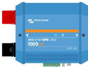
Lynx Smart BMS NG 500 A y 1000 A