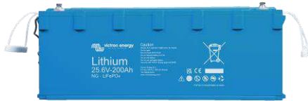
Batería Lithium NG 25,6 V 200 Ah