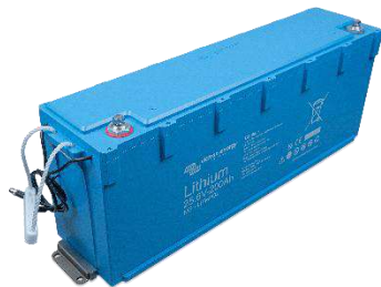
Asegurada con soportes de montaje