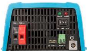
Inverter 12/375 VE.Direct