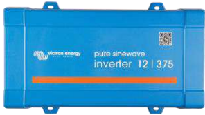
Inverter 12/375 VE.Direct