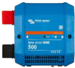
Lynx Smart BMS 500 A