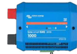
Lynx Smart BMS 1000 A