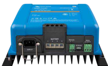
Cargador Smart IP43 12/50(3)