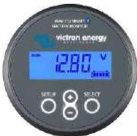
Sensor Bluetooth: Monitor de baterías BMV-712 Smart