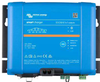
Cargador Smart IP43 12/50(1+1)