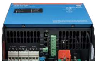
Área de conexión MultiPlus-II 3k