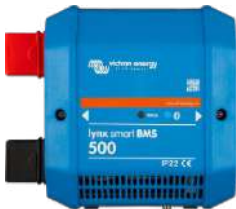
Lynx Smart BMS 500 A