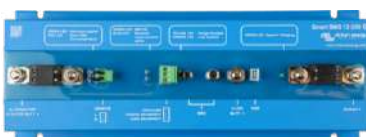
Smart BMS 12/200