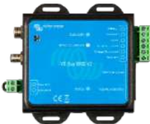
VE.Bus BMS V2