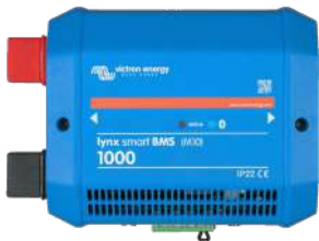
Lynx Smart BMS 1000 A