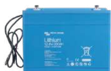
Lithium Battery Smart de 12,8 V y 25,6 V