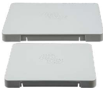
Cubierta de plástico protectora GX Touch 50 y 70 (no para los modelos Flush)