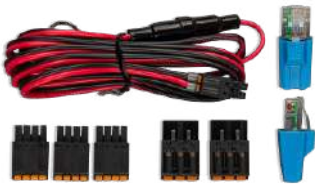
Accesorios incluidos con el Cerbo GX