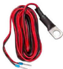
Sensor de temperatura para Quattro, MultiPlus y dispositivo GX (como el Cerbo GX).