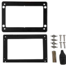
Accesorios incluidos con GX Touch 50/70