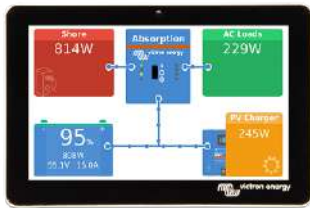
GX Touch (pantalla opcional para Cerbo GX y Cerbo-S GX)