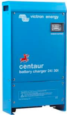
Centaur Battery Charger 24 30