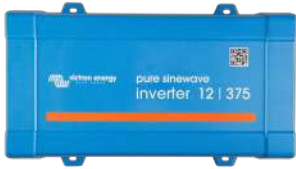
Inverter 12/375 VE.Direct