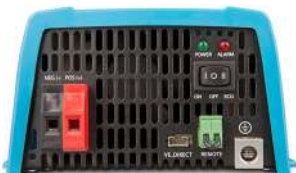
Inverter 12/375 VE.Direct