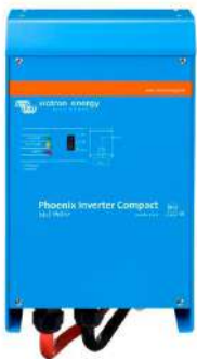
Inverter Compact 24/1600

Las posibilidades que ofrecen los inversores de alta potencia conectados en paralelo son realmente asombrosas. Para obtener ideas, ejemplos y cálculos de capacidad de baterías, le rogamos consulte nuestro libro "Energy Unlimited" (energía ilimitada), disponible gratuitamente en Victron Energy y descargable desde www.victronenergy.com.es .