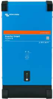
Inverter Smart 12/3000