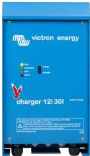
Cargador 12 V 30 A