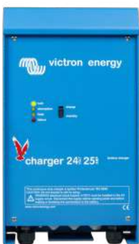
Cargador 24 V 25 A