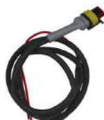
Cable de control para Cyrix 12/24-230 Longitud: 1 m