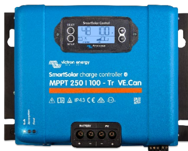
Controlador de carga SmartSolar MPPT 250/100-Tr-VE.Can con pantalla conectable opcional