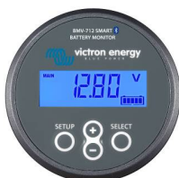
Sensor Bluetooth: Monitor de baterías BMW-712 Smart