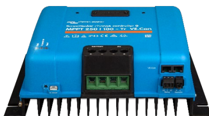
Controlador de carga SmartSolar MPPT 250/100-Tr-VE.Can sin pantalla