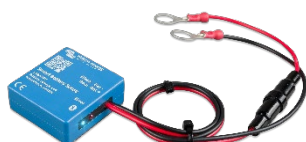
Sensor Bluetooth: Smart Battery Sense