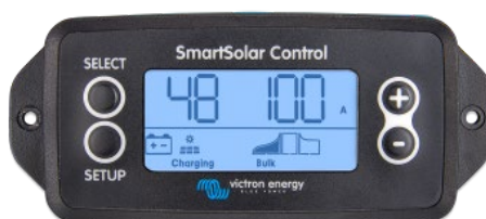
Pantalla conectable SmartSolar